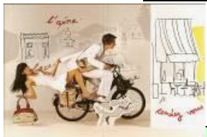
CoSolexage En avant toutes