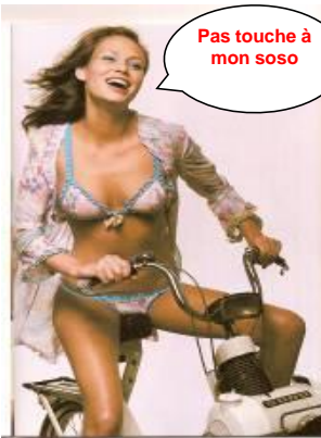
Le soso que au bonheur