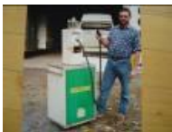
Le plein svp Sisi