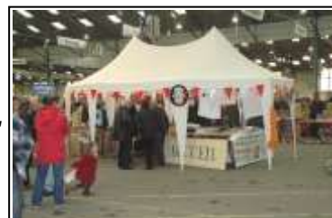
Stand "accueil" ABVA